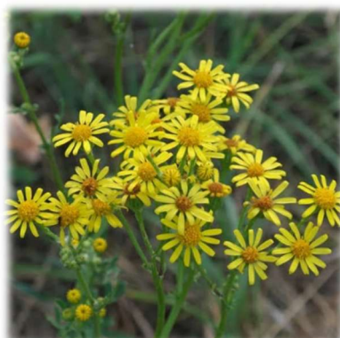
Das Jakobskreuzkraut ( Jacobaea vulgaris , ehem. Senecio jacobaea ) ist eine stark giftige Pflanze, die vor allem auf Wiesen und Weiden vorkommt. Die größte Gefahr geht von Verwechslungen mit ungiftigen Wildkräutern, Heilpflanzen (wie dem Johanniskraut) oder sogar essbarem Salat ( Rucola ) aus