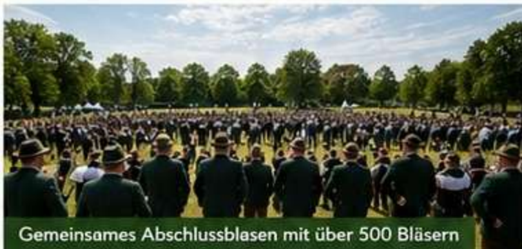
Gemeinsames Abschlussblasen mit über 500 Bläsern