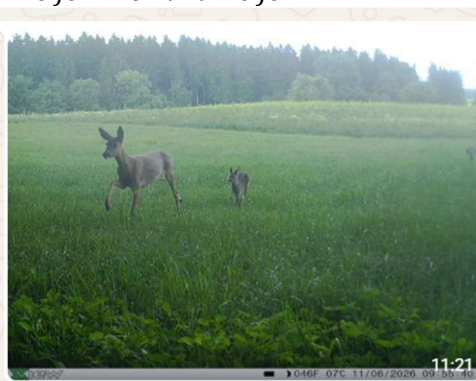
Danke für eure Flüge gr aus kb 11:21