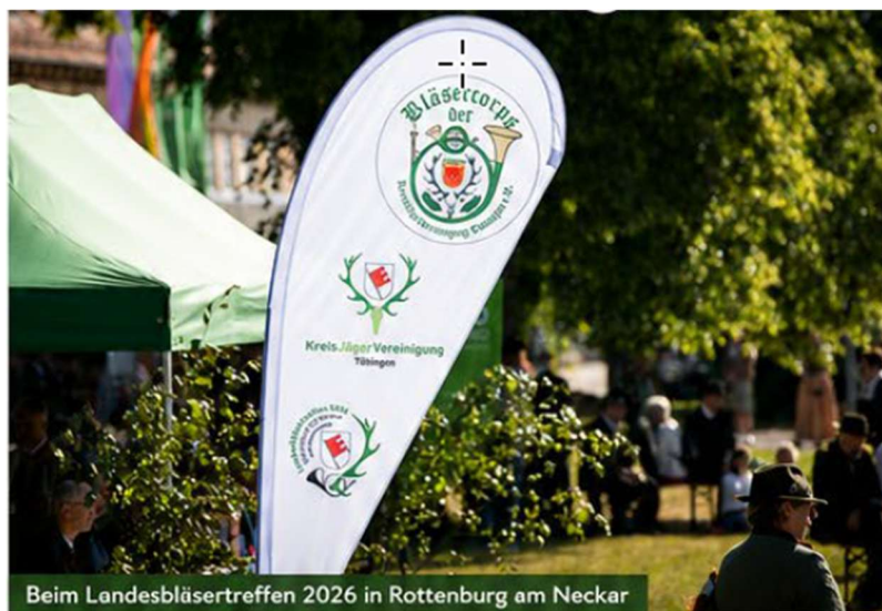
Beim Landesbläsertreffen 2026 in Rottenburg am Neckar

Am 13. und 14. Juni 2026 nahm die Jagdhornbläsergruppe der Jägervereinigung Ehingen am 37. Landesbläsertreffen der Jagdhornbläser Baden-Württemberg in Rottenburg am Neckar teil. Über 500 Bläserinnen und Bläser aus Baden-Württemberg, den benachbarten Bundesländern und sogar aus dem angrenzenden Ausland waren der Einladung des Landesjagdverbandes Baden-Württemberg und der Kreisjägersvereinigung Tübingen gefolgt.