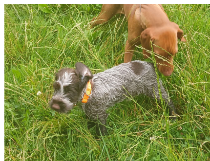
Welpenkurs: Spielerische Förderung von Bindung, Orientierung und Nasenarbeit.

Im anschließenden Junghundekurs wurden diese Grundlagen weiter gefestigt. Neben Gehorsam und Sozialverhalten standen erste jagdliche Elemente wie das Tragen von Dummys und einfache Schleppen auf dem Ausbildungsplan.