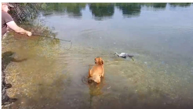
Wasserarbeit: Ein wichtiger Baustein auf dem Weg zur Brauchbarkeitsprüfung.

Darauf aufbauend erfolgte die weiterführende Ausbildung. Hier wurden Schweißarbeit, Schleppen, Apportieren sowie die Gewöhnung an die Wasserarbeit trainiert. Ein weiterer wichtiger Bestandteil war der Besuch eines Wildschweingatters. Alle jungen Hunde zeigten dort einen guten Ansatz auf Schwarzwild.